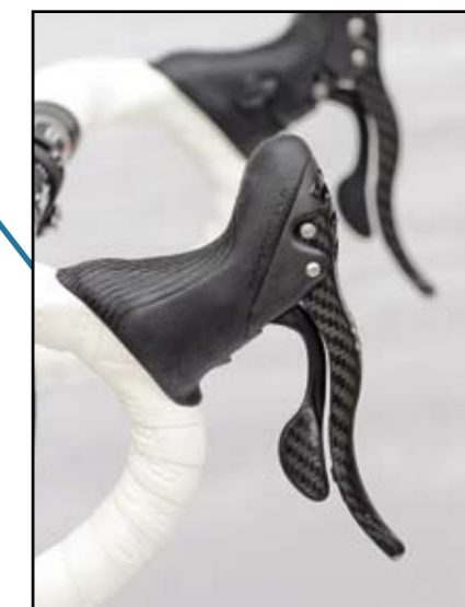
> Zeer ergonomisch vormgegeven shifters