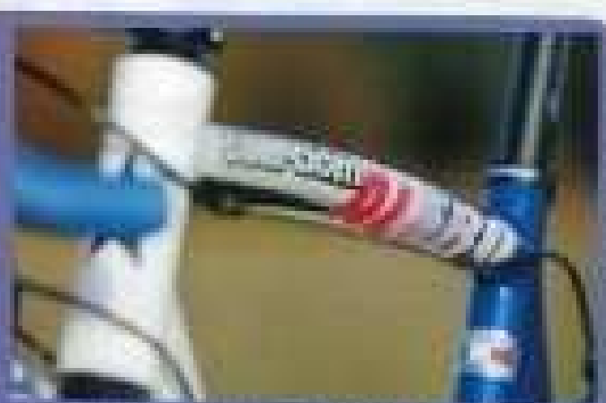
Le cadre Guerciotti Alero est fabriqué en carbone, ce qui lui confère une rigidité et une résistance exceptionnelles. De plus, le cadre est fabriqué en Italie, ce qui garantit une qualité de fabrication optimale. C'est ainsi que la Guerciotti a été créée en 1976 par un ingénieur, et que la marque a été créée en 1976.

... Ce cadre est fabriqué en carbone, ce qui lui confère une rigidité et une résistance exceptionnelles. De plus, le cadre est fabriqué en Italie, ce qui garantit une qualité de fabrication optimale. C'est ainsi que la Guerciotti a été créée en 1976 par un ingénieur, et que la marque a été créée en 1976.